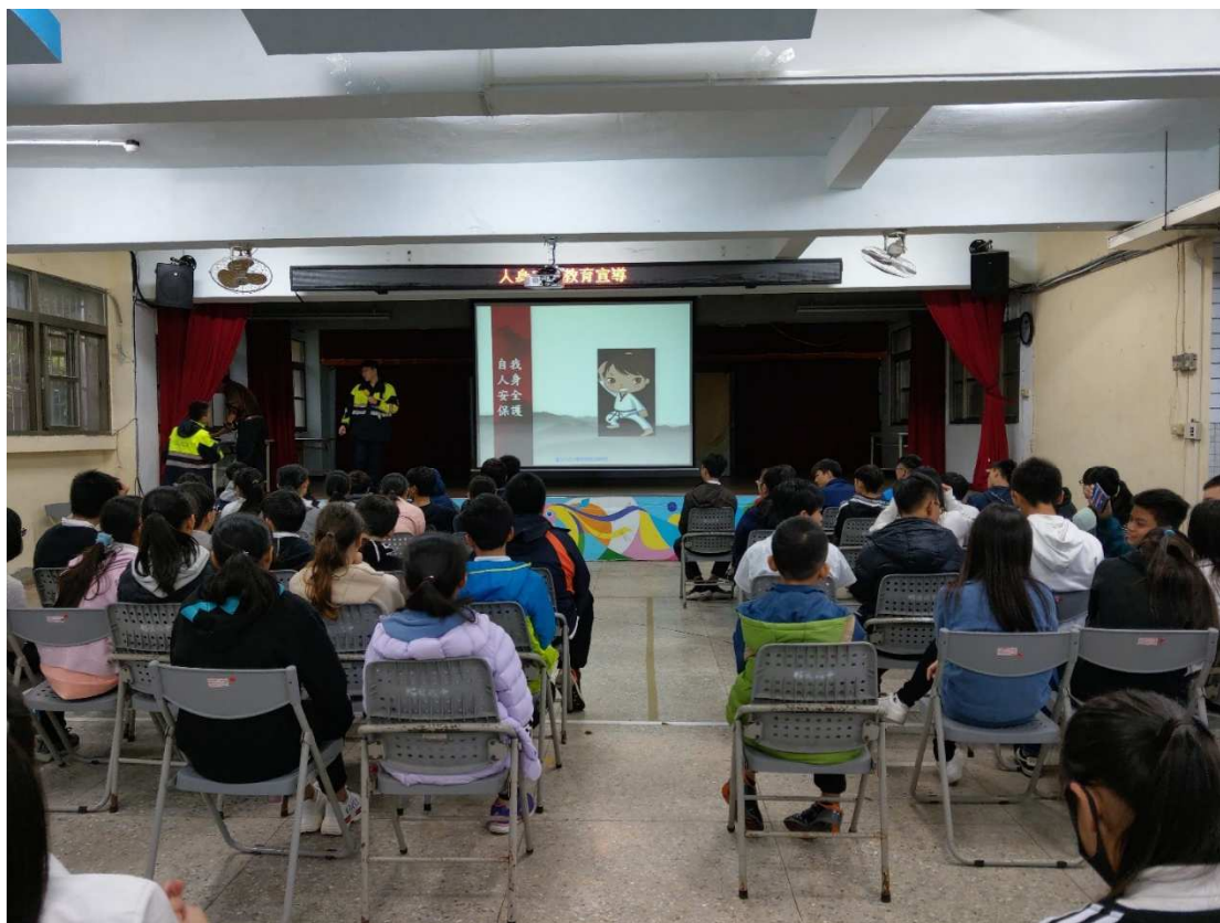
108. 11. 22 邀請山仔后派出所同仁到校進行人身安全專題演講

8. 108 學年至少辦理 1 場次防災教育專題講座，邀請防災學者、專家蒞校專題演講，學校所有教職員工及學生共同參與。