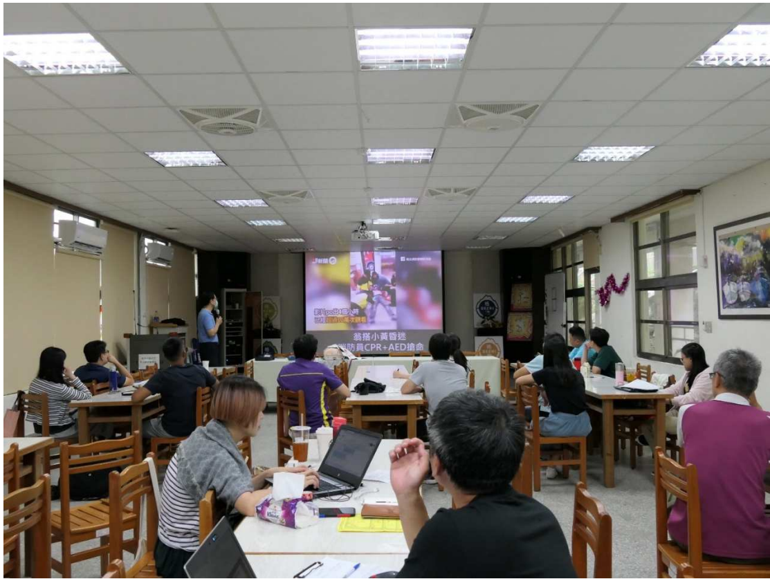
109. 7. 16 邀請台灣安全保護協會到校進行強震逃生+CPR+AED 專題演講