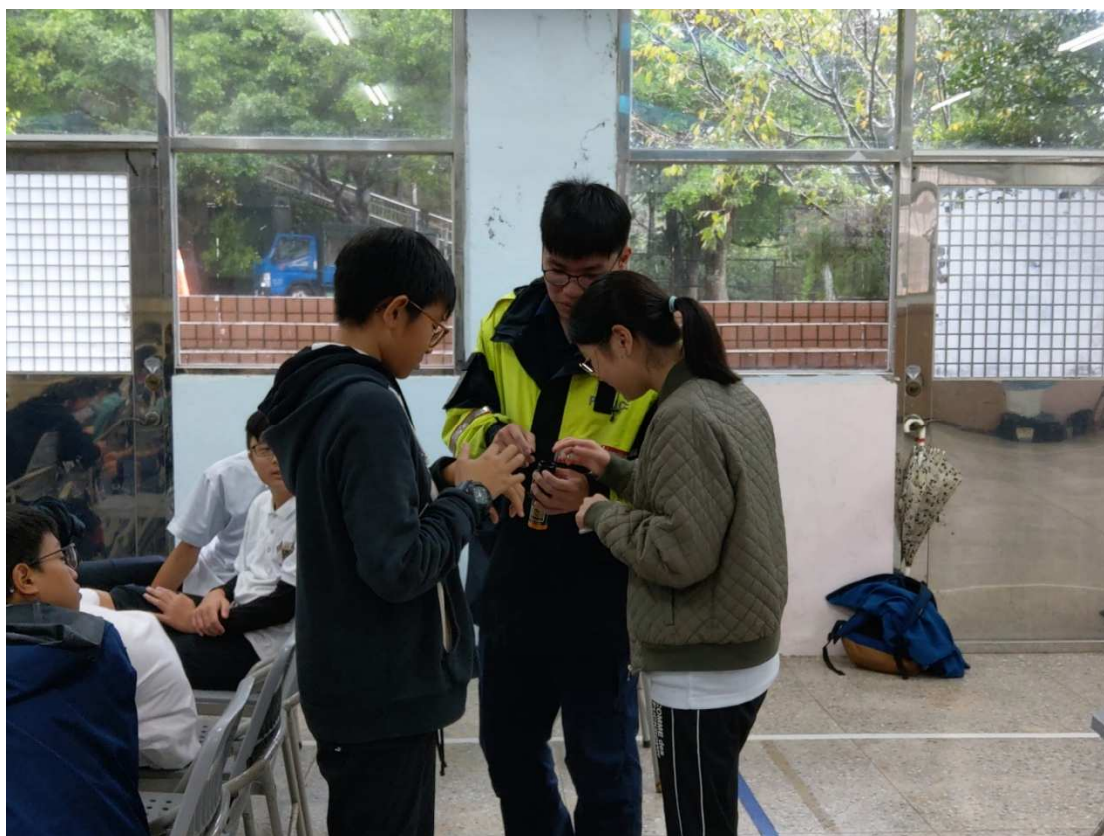
108. 11. 22 邀請山仔后派出所同仁到校進行人身安全專題演講