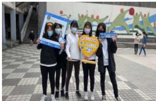
學生熱情響應交通安全月活動