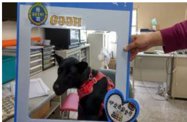
交通安全月—黑莓(校犬)宣傳大使