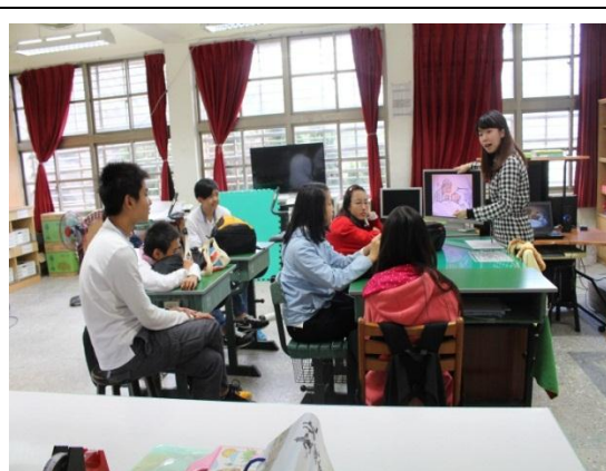
專輔老師將性教育及家庭教育融入課程中 (105.12.2)