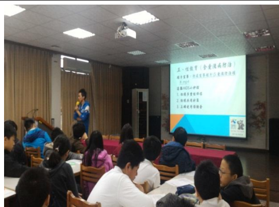
體衛組長將於週會時做性教育知識宣導 (105.12.9)