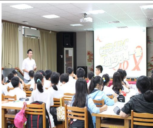
體衛組長於於週會時做性教育防治宣導 (105.9.10)