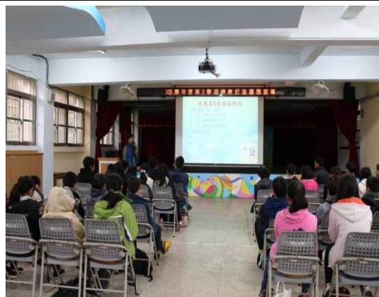
學務主任於朝會時做性教育愛滋病防治宣導講座(106.3.17)