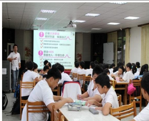
體衛組長於於週會時做性教育防治宣導並給學生填寫學習單 (105.9.10)