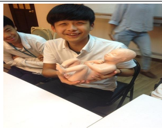
體驗新生命的誕生擁抱嬰兒 (106. 4. 20)