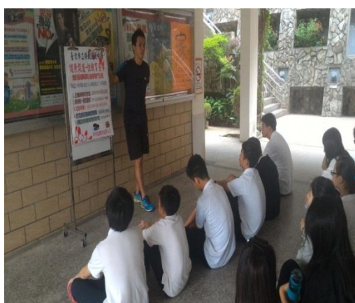
健教老師將健康促進性教育愛滋病防治融入課程教學 (105.9.8)