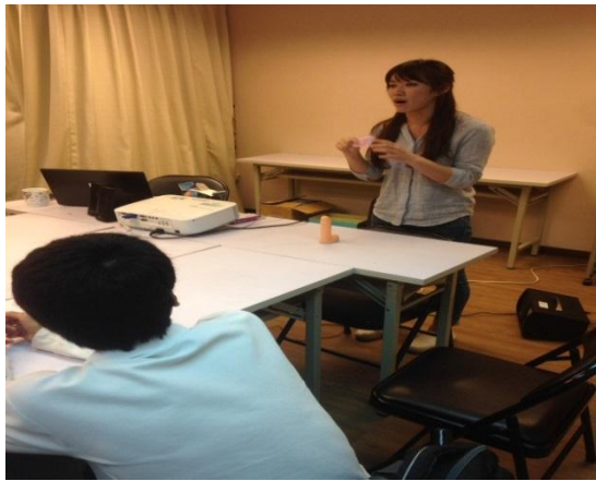
優生保健教導男性生殖器官及保險套使用 (106. 4. 20)