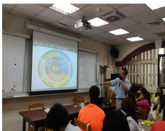
參加大理高中辦理的臺北市健康促進性教育計畫增能研習受益良多 (105.10.6)