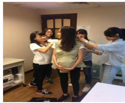
讓學生及老師體驗懷孕過程媽媽的辛苦(106. 4. 20)