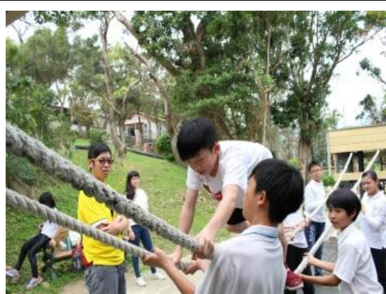
福音園低空體驗教育-提升團隊技能及學生自我認同感及生命教育 (105.9.10)