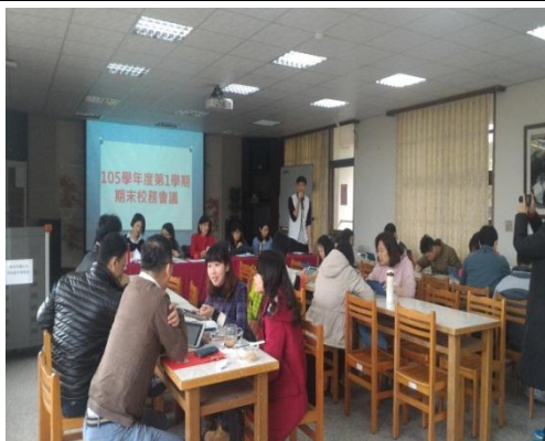
期末校務會議中向全校教職員工及家長代表宣導本校健康促進內容 (106.1.19)