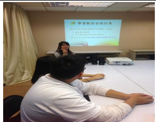
講師教導學生性教育-較安全性行為 (106. 4. 20)