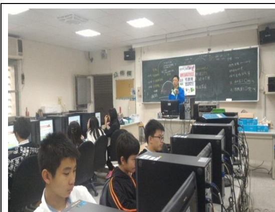
學生性教育網路資訊後測時 (106. 3. 31)