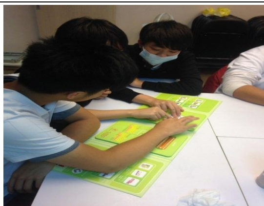
讓學生認識女生生殖器官及避孕藥如何避孕方法(106. 4. 20)