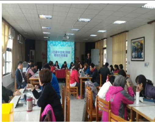
期初校務會議中向全校教職員工及家長代表宣導本校健康促進項目 (106.2.7)