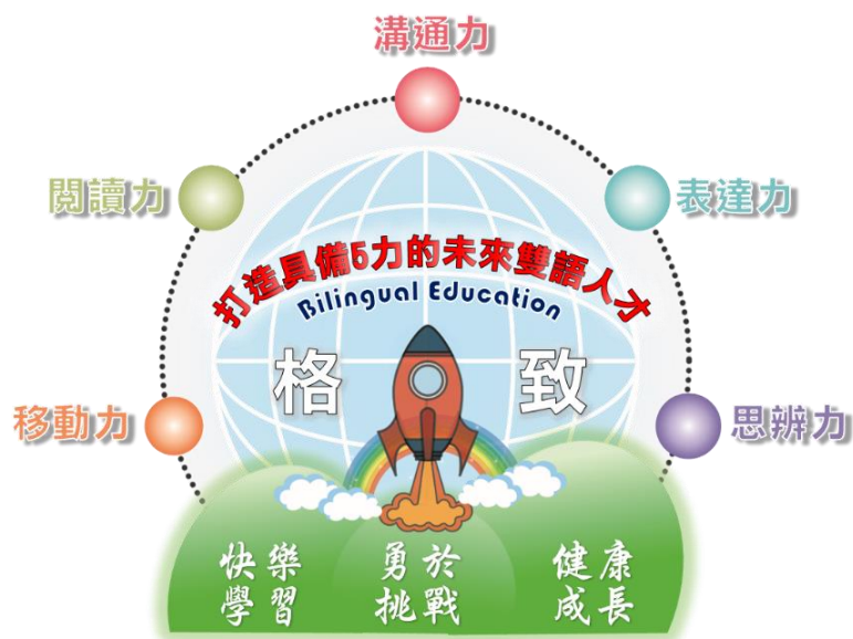
▲本校雙語教育願景圖像